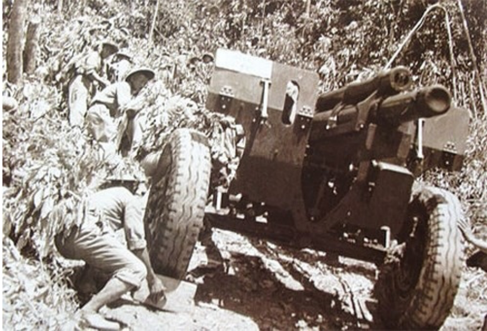
Quân dân kéo pháo vượt núi tiếp cận chiến trường Điện Biên Phủ.