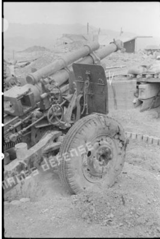
Pháo 105 mm Howitzer bị hư hại do hỏa lực của Việt Minh trên một trong những cứ điểm của trại cố thủ Điện Biên Phủ.