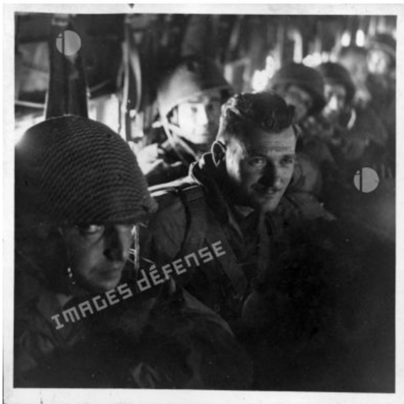
Không lâu trước khi nhảy vào Điện Biên Phủ, lính dù từ BPC số 6 (tiểu đoàn nhảy dù thuộc địa) được gửi đến tiếp viện.