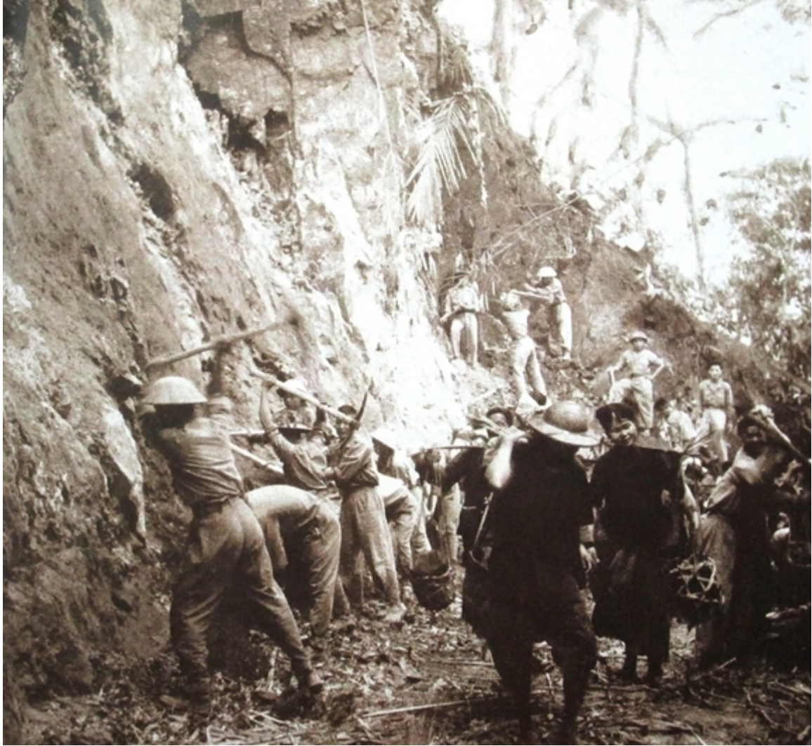
Dân công, thanh niên xung phong mở đường vào Điện Biên Phủ.