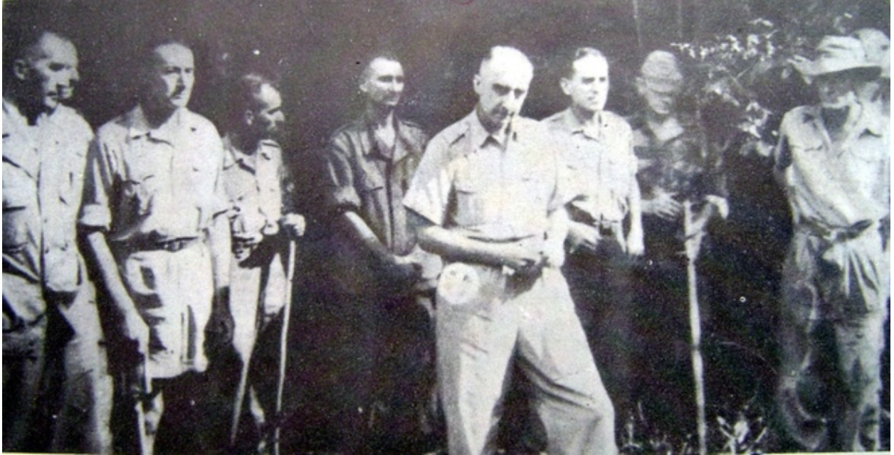
Tướng De Castries cùng toàn bộ Bộ tham mưu bị bắt sống.