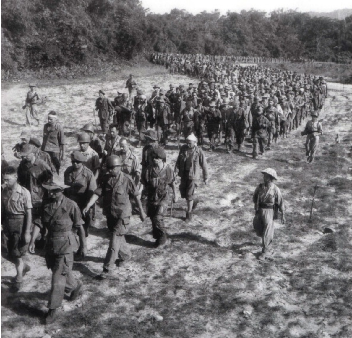
Những binh sĩ Pháp đầu hàng được áp giải đến nơi tạm giam sau thất bại tại chiến trường Điện Biên Phủ.