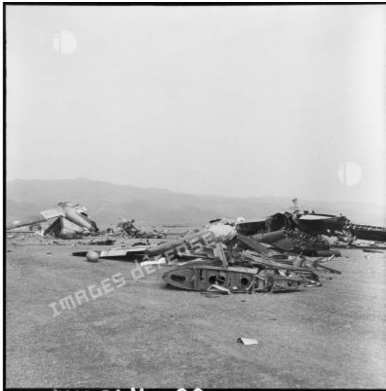
Xác máy bay bị pháo binh Việt Minh phá hủy trong trại cố thủ Điện Biên Phủ.

Nhân kỷ niệm 70 năm trận Điện Biên Phủ, ECPAD mời các bạn (tái) khám phá những hình ảnh ý nghĩa về “thất bại vẻ vang” này. Đắm chìm trong lòng kho tàng của quân đội Pháp, nổi tiếng hay chưa xuất bản, qua cuốn sách Trận Điện Biên Phủ và nhiều nội dung số khác nhau.