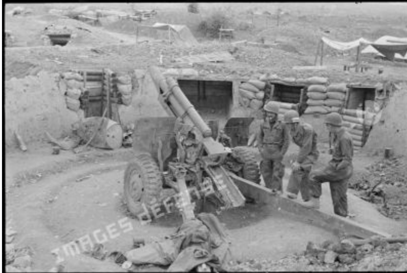
Lính pháo binh xung quanh một khẩu pháo 105 mm bị Việt Minh làm hư hại bắn vào một trong những cứ điểm của trại cố thủ Điện Biên Phủ.