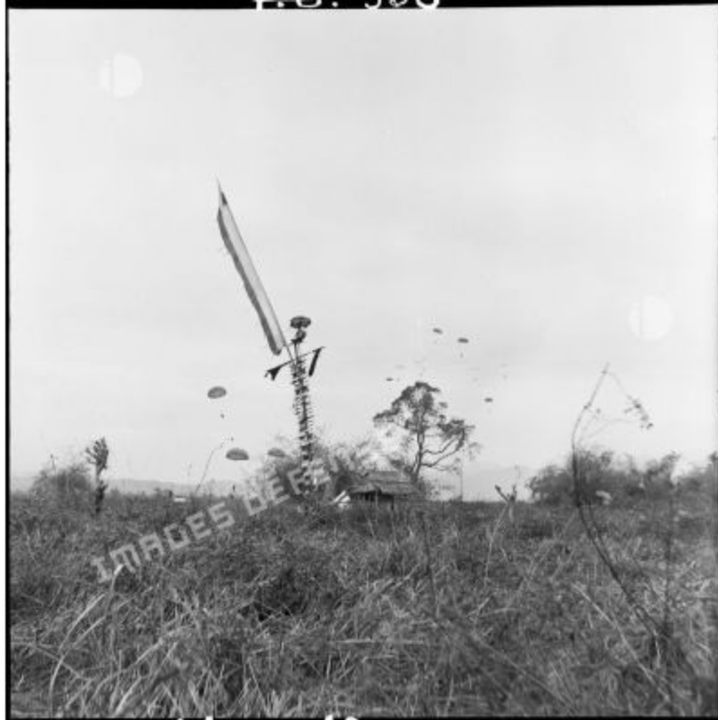
Tiểu đoàn 6 BPC (tiểu đoàn nhảy dù thuộc địa) được nhảy dù để tăng cường phía trên DZ (vùng thả quân) của trung tâm kháng chiến Isabelle, phía nam trại cố thủ Điện Biên Phủ.