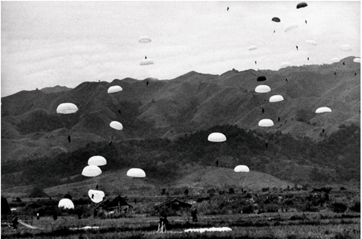
Ngày 20/11/1953, quân Pháp nhảy dù xuống Điện Biên Phủ, mở đầu giai đoạn chiếm đóng vùng đất xứ Thái, Tây Bắc Việt Nam.

Chiến thắng lịch sử Điện Biên Phủ, đỉnh cao của cuộc kháng chiến chống thực dân Pháp đã khẳng định đường lối kháng chiến đúng đắn, sáng tạo của Đảng và Chủ tịch Hồ Chí Minh là đường lối kháng chiến toàn dân, toàn diện, trường kỳ tự lực cánh sinh, đã phát huy cao độ truyền thống yêu nước, ý chí chiến đấu vì độc lập, tự do của dân tộc Việt Nam. Chiến thắng Điện Biên Phủ trở thành mốc son chói lọi trong lịch sử của dân tộc ta, đồng thời tác động mạnh mẽ đến phong trào đấu tranh vì hòa bình, độc lập dân tộc, dân chủ và tiến bộ xã hội trên thế giới.