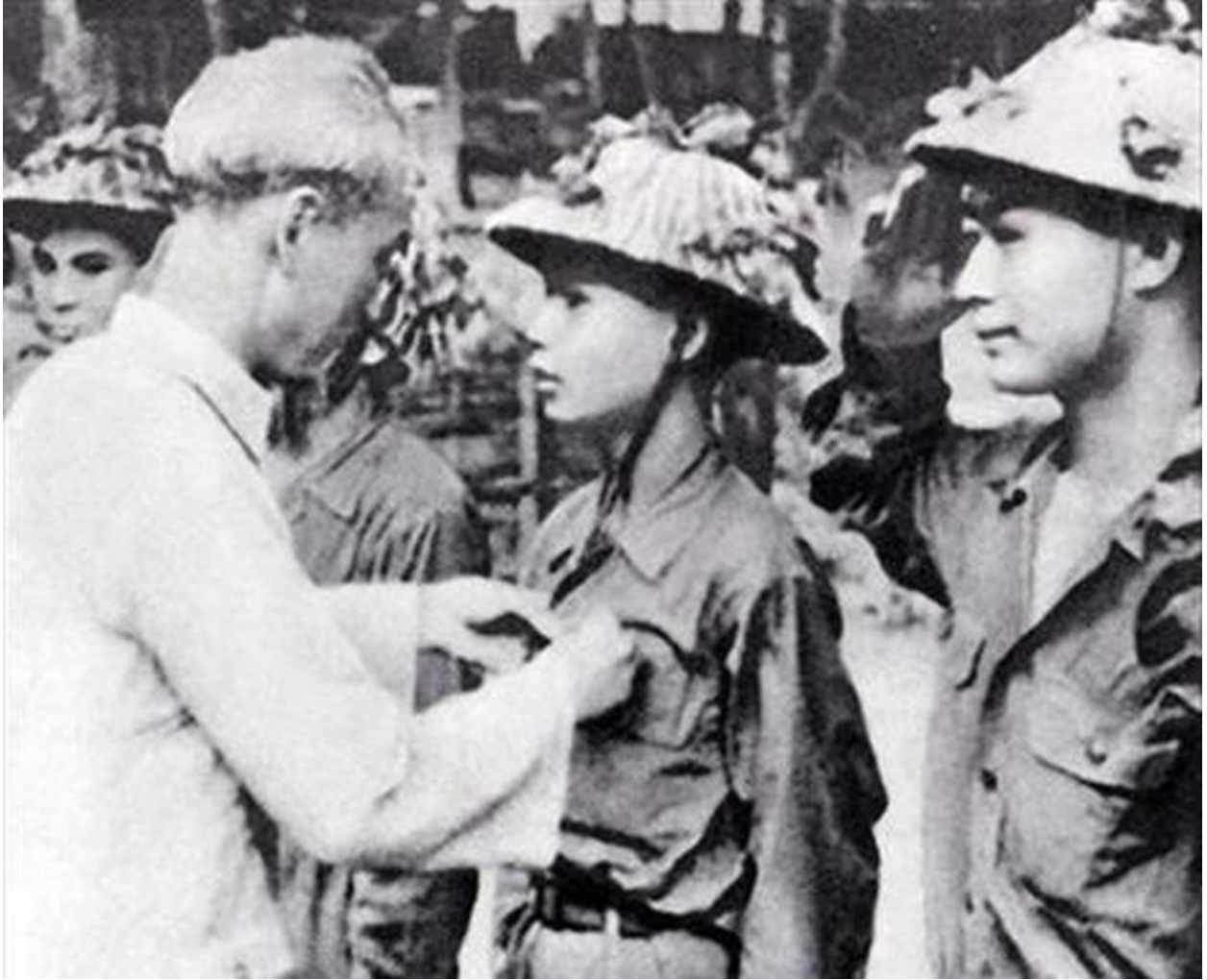
Chủ tịch Hồ Chí Minh thưởng huy hiệu cho các chiến sĩ lập nhiều chiến công trong chiến dịch Điện Biên Phủ.