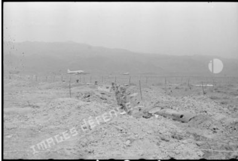
Gần đường băng của trại cố thủ Điện Biên Phủ, lính dù tăng cường các vị trí phòng thủ.