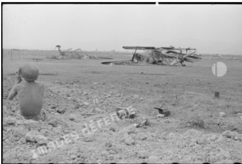
Xác của các máy bay vận tải, đặc biệt là chiếc Morane 500, bị pháo binh Việt Minh nhắm tới trong trận chiến ở Điện Biên Phủ.