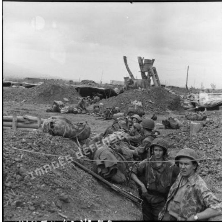
Những người thuộc Tiểu đoàn Nhảy dù Thuộc địa số 6 (BPC) ẩn nấp chờ đợi trong chiến hào Điện Biên Phủ trước khi lên chiếm các vị trí mới.