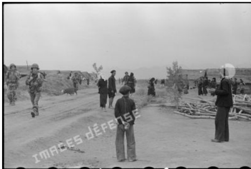
Quân nhảy dù gần trại Điện Biên Phủ băng qua một ngôi làng có người dân tộc Thái sinh sống.