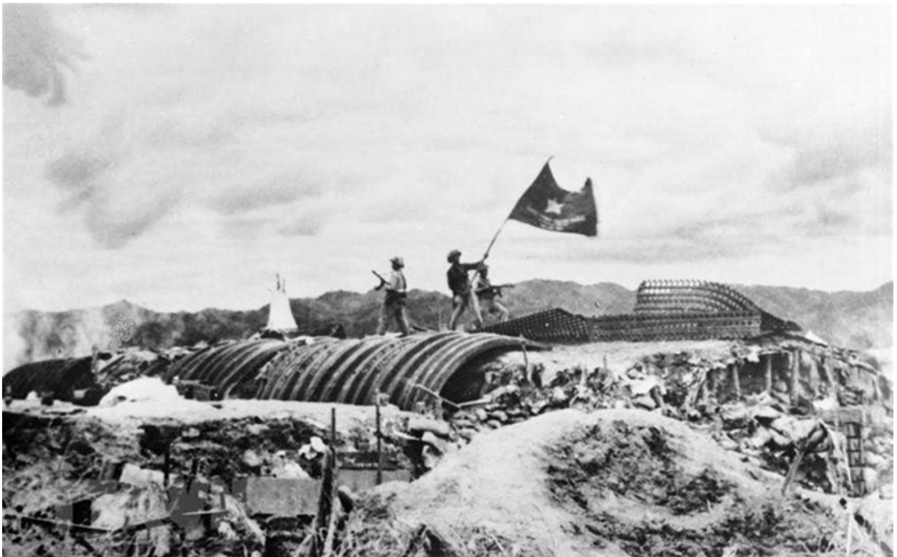
Sau 56 ngày đêm chiến đấu, hy sinh, gian khổ, quân và dân Việt Nam đã tiêu diệt toàn bộ Tập đoàn cứ điểm Điện Biên Phủ. Chiều ngày 7/5/1954, lá cờ "Quyết chiến, quyết thắng" tung bay trên nóc hầm De Castres