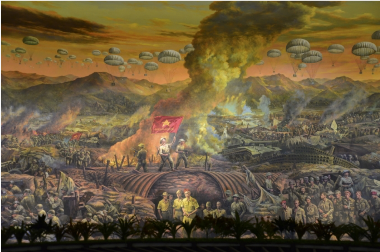
Bức tranh Panorama - tái hiện toàn cảnh Chiến dịch Điện Biên Phủ