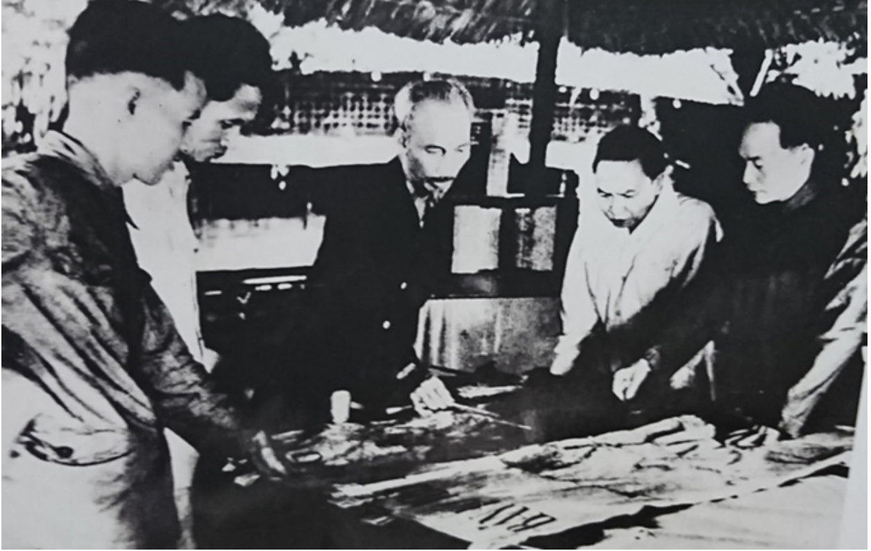
Ngày 6/12/1953, tại Tín Keo, xã Phú Đình, huyện Định Hoá, tỉnh Thái Nguyên, Chiến khu Việt Bắc, Chủ tịch Hồ Chí Minh cùng với các đồng chí trong Bộ Chính trị thông qua chủ trương, kế hoạch tác chiến Đông – Xuân (1953 – 1954), quyết định mở Chiến dịch Điện Biên Phủ.