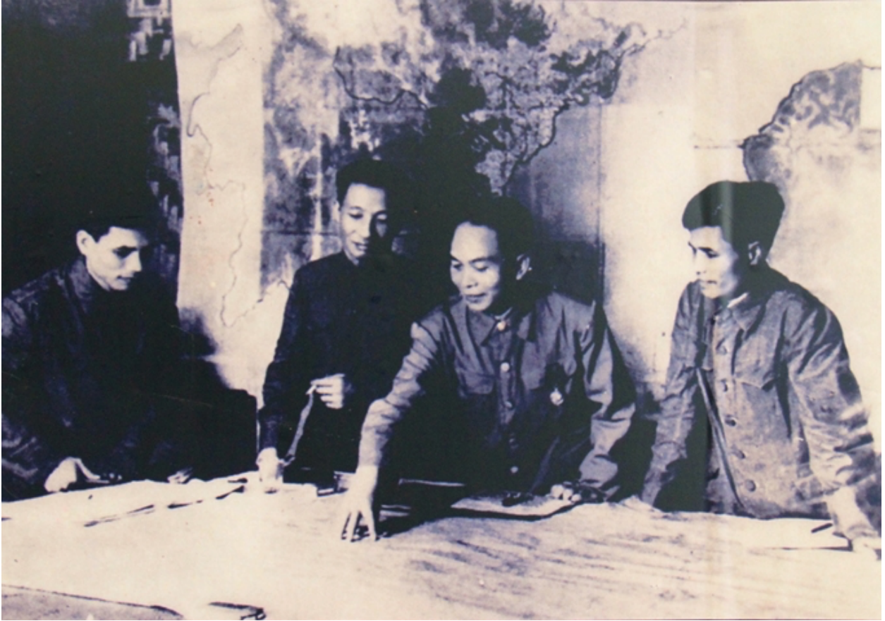
Đại tướng Võ Nguyên Giáp trong chiến dịch Điện Biên Phủ.