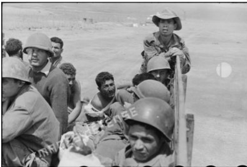
Vận chuyển thương binh bằng xe tải tới đường băng của trại cố thủ Điện Biên Phủ.