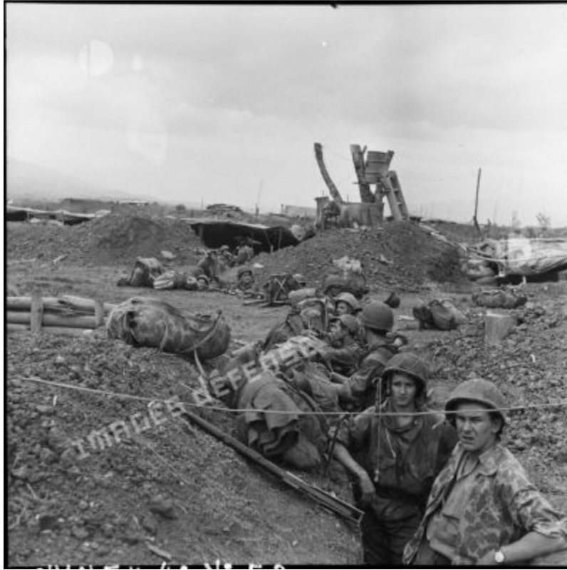
Những người thuộc Tiểu đoàn Nhảy dù Thuộc địa số 6 (BPC) ẩn nấp chờ đợi trong chiến hào Điện Biên Phủ trước khi lên chiếm các vị trí mới.