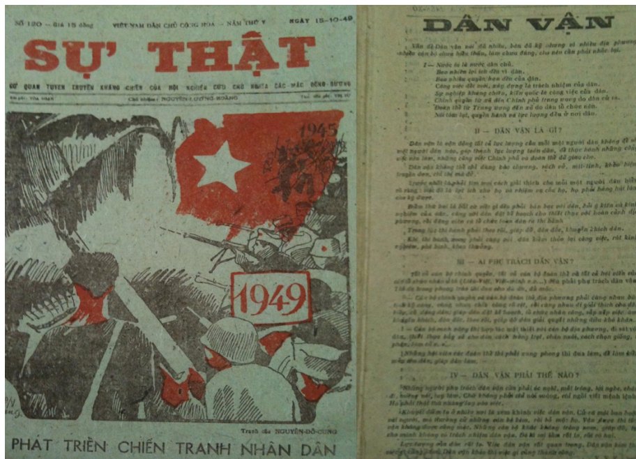
Tác phẩm “Dân vận” đăng trên báo Sự Thật ngày 15/10/1949

Vấn đề dân chủ, phát huy quyền làm chủ của nhân dân, lấy nhân dân làm gốc luôn là một trong những tôn chỉ hành động trong con đường cách mạng của Đảng ta. Ngay từ những năm đầu thành lập nước Việt Nam Dân chủ Cộng hòa, Chủ tịch Hồ Chí Minh đã nhấn mạnh địa vị cao nhất là dân, “bao nhiêu lợi ích đều vì dân, bao nhiêu quyền hạn đều của dân” trong bài viết “Dân vận” gửi cán bộ đảng viên cả nước ngày 15-10-1949. Cả cuộc đời của Người cống hiến cho dân tộc, Bác luôn thực hiện dân chủ, dân vận, phát huy đại đoàn kết dân tộc, tất cả đều xuất phát từ một chữ “dân” và xem đó là chân lý để hành động cho suốt cuộc đời cách mạng của Người. Trước lúc đi xa, Bác đã nhắc lại câu ca dao: “Dễ trăm lần không dân cũng chịu, khó vạn lần dân liệu cũng xong”. Người cũng từng viết “Dân chủ là của quý báu nhất của nhân dân, chuyên chính là cái khóa, cái cửa để đề phòng kẻ phá hoại, nếu hòm không có khóa, nhà không có cửa thì sẽ mất cắp hết. Cho nên có cửa phải có khóa, có nhà phải có cửa. Thế thì dân chủ cũng cần phải có chuyên chính để giữ gìn lấy dân chủ”.